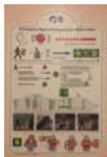
安全に関する注意(イメージ)