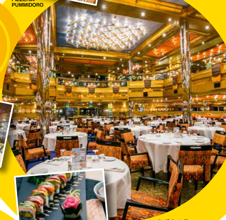
メインダイニング アラカルトのコース料理となります。