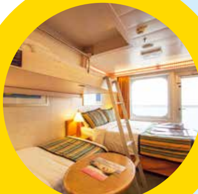
4名1室利用イメージ