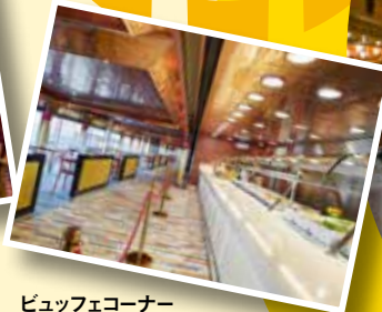
ビュッフェコーナー お好きな時間に自由に 気軽にお食事が出来ます。