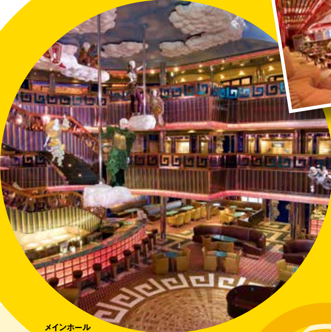
メインホール ギリシャ神話をモチーフにした 華やかな雰囲気を楽しめます。