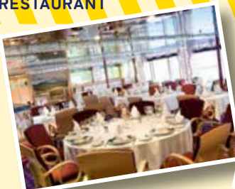
有料レストラン CASANOVA 特別なファンク上のレストランで、 ゆっくりお楽しみください。