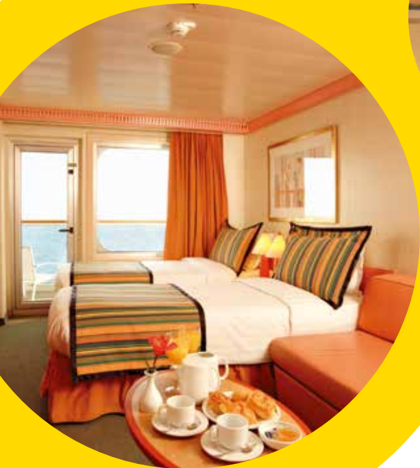
2名1室利用イメージ