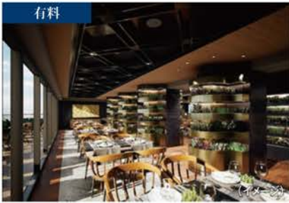
CHEF'S GARDEN KITCHEN シェフズ・ガーデン・キッチン