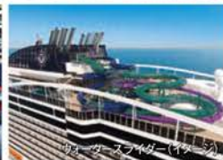
ウォータースライダー(イメージ)