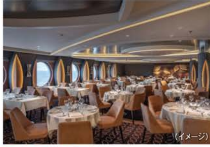
LA FOGLIA ラ・フォリア(メインレストラン一例)