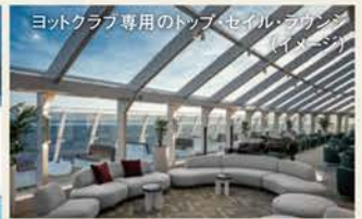
ヨットクラブ専用エリア(イメージ)