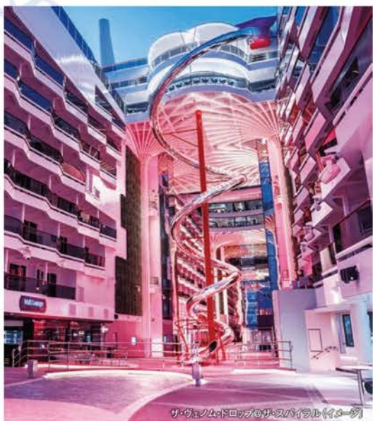
ザ・ヴェヌム・ドロップ@ザ・スパイラル(イメージ)

11デッキ分を螺旋状に滑り降りる「ザ・ヴェヌム・ドロップ@ザ・スパイラル」や最新鋭のVR技術を用いたウォータースライダーを有するオーロラアクアパークなどの施設、本格的なショーはもちろん、5Dシネマから体を動かすアクティビティまで、あらゆる年齢層の方々にお楽しみいただける仕掛けが盛りだくさん。