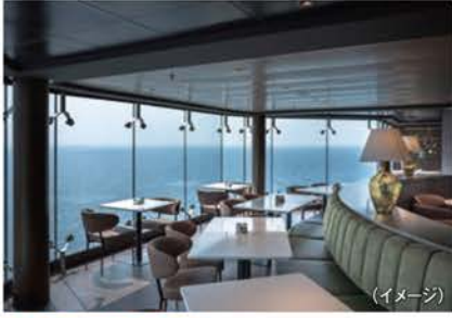
IL MERCATO イル・メルカート(ビュッフェ)

洗練された13ヶ所のレストランでは地中海料理など各国の料理を提供(一部有料)します。メインダイニングの日替りコースをはじめ、ビュッフェレストランから小腹を満たすファストフード店まで幅広い選択肢をご用意。ミシュランの星を獲得したシェフ監修のレストラン(有料)には洋上初のハイドロポニク(水耕)ガーデンを備え、フレッシュな美味しさもお楽しみいただけます。