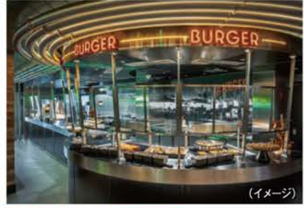
PIZZA & BURGER ピッツァ&バーガー(ビュッフェ)