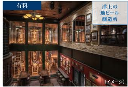
MASTERS OF THE SEA マスターズ・オブ・ザ・シー