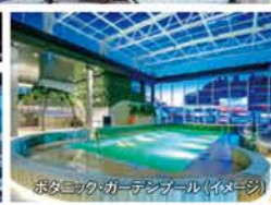
ポタニック・カーテンプール(イメージ)