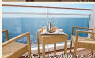
バルコニーからの眺め(イメージ)