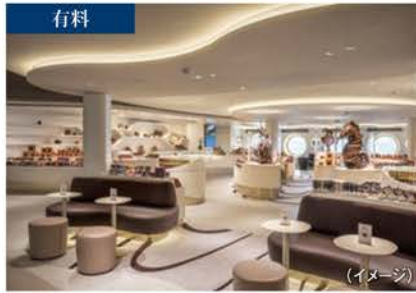
JEAN-PHILIPPE CHOCOLAT & CAFÉ ジャン・フィリップ・ショコラ&カフェ