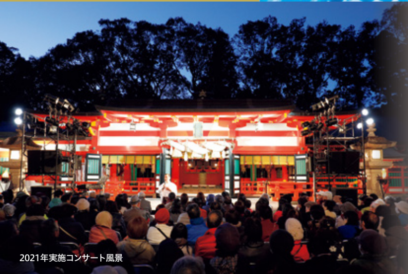
2021年実施コンサート風景

2001年「涙そうそう」をリリース。2021年沖縄県世界自然遺産大使に任命される。その唄声は今もなお日本に留まらずアジアや南米からも高い評価を受け続けている。今年7月から全国ツアー「たびぐる2023」をスタートさせる。 ※クルーズへの乗船はございません。