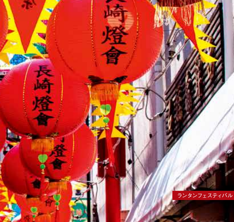
ランタンフェスティバル