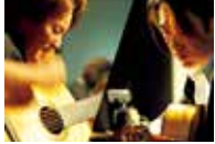
ドンアルマス [スパニッシュ ギターユニット]