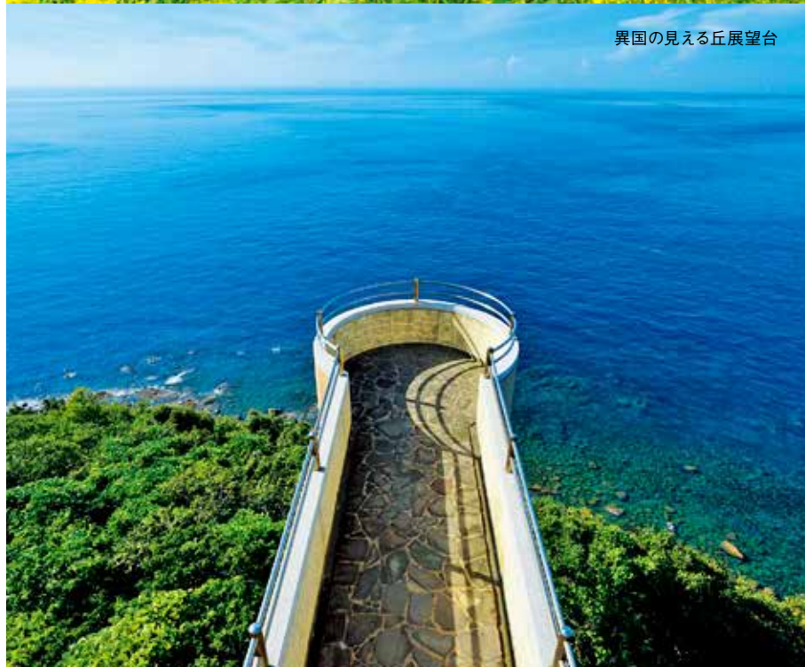
異国に見える丘展望台