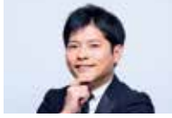
三四郎 [マジシャン]