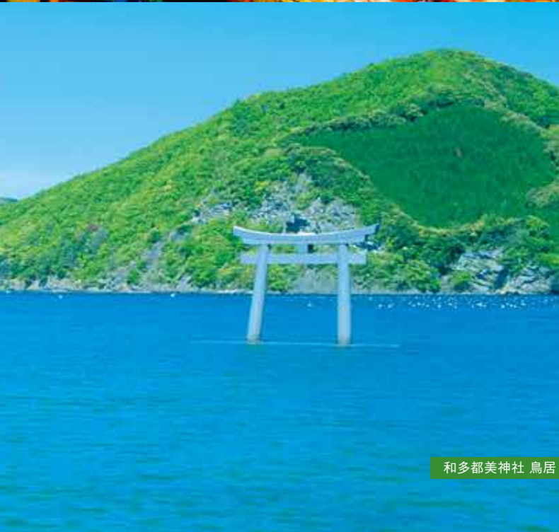
和多都美神社 鳥居