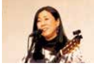
李 政美 (いぢよんみ) [歌手・シンガーソング ライター]