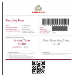
ボーディングパスイメージ

完了後、ボーディングパスをダウンロードし、ご乗船当日にご持参ください。（プリントアウトまたはデータ）