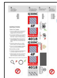
荷物タグイメージ

オンラインチェックインのお手続きは以上となります。円滑なご乗船手続きへのご協力誠にありがとうございます。