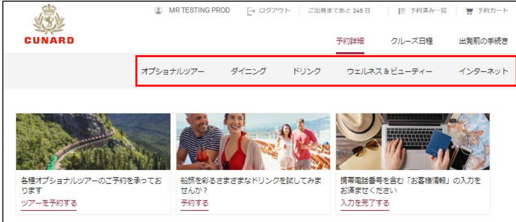
マイキュナード トップページ