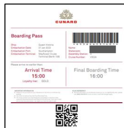
乗船券パスイメージ

ダウンロードした「乗船券」は印刷し、乗船日当日、パスポートと一緒にターミナルにご持参いただくか、ダウンロードしたスマートフォン等の端末を忘れずにご持参ください。「荷物タグ」は印刷し、折り目にそって折り畳み、ターミナルでお預けされるお荷物にホチキスで取り付けてください。