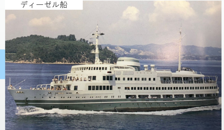
1960年に就航した「3代目くれない丸」。ディーゼルエンジンを搭載し、当時の高速船（18ノット）で昼の瀬戸内海を航行。