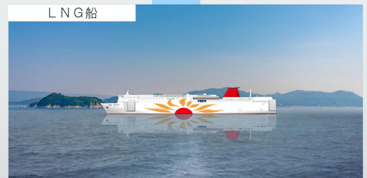
2022年から23年にかけて就航予定の「さんふらわあくれない」「さんふらわあむらさき」。新たな瀬戸内海の女王として復活。 ※船名は仮称