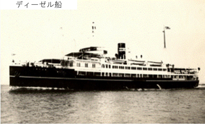
1924年に就航した「2代目紅丸」。ディーゼルエンジンを搭載し14ノットの快速を誇った。