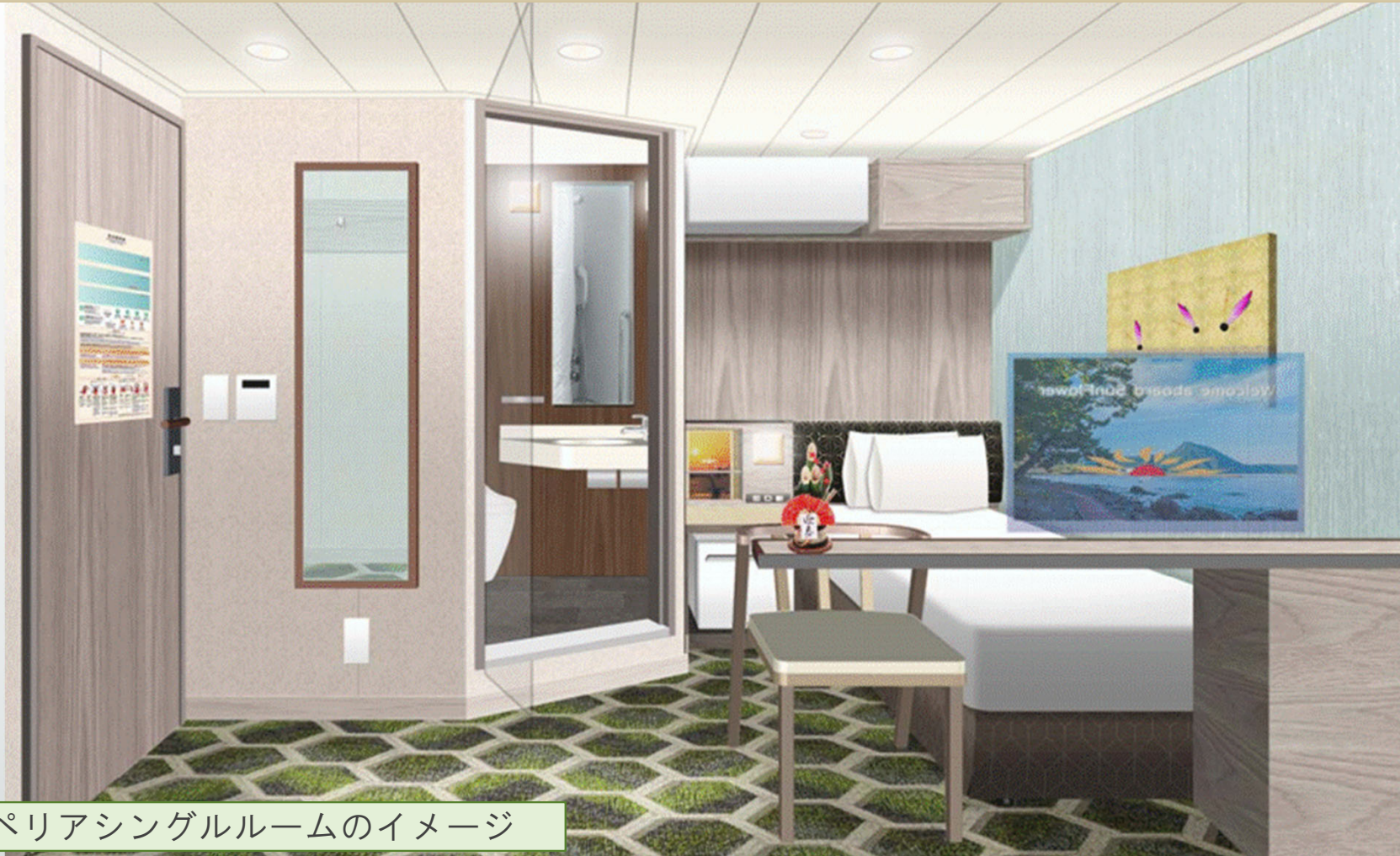
スーペリアシングルルームのイメージ