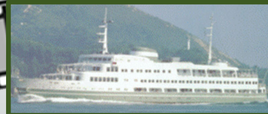
姉妹船 2代目むらさき丸(昭和35年)