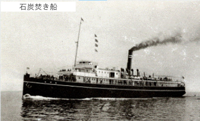
1912年、大阪商船が別府航路に投入した「紅丸」。