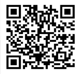
Android Hub App