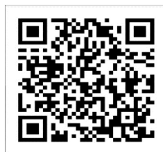
iOS Hub App