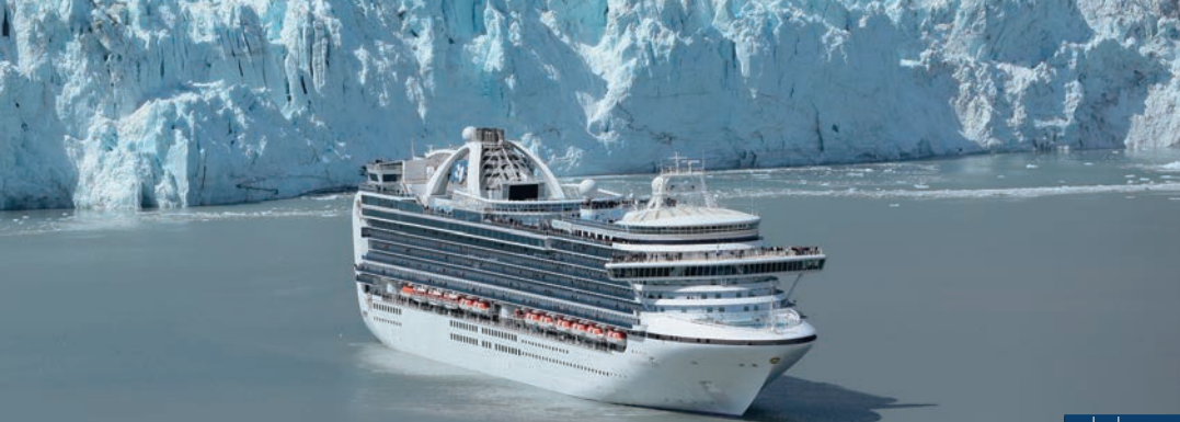
世界遺産 グレーシャーベイ(イメージ)