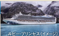
ルビー・プリンセス(イメージ)

イタリアの広場のようなアトリウム「ピアッツァ」を持つ人気のクラス。豊富なディナーのセレクションに加え、新しい定番施設も網羅しています。