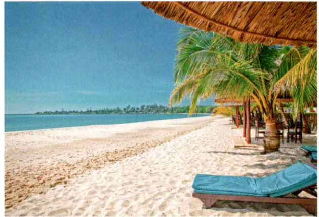
ソカビーチ(シアヌークビル)