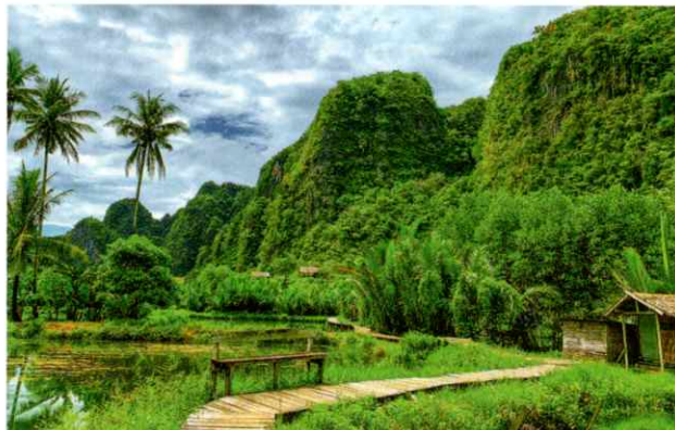
ランランマン(マカッサル)