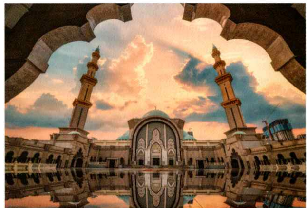
連邦直轄領モスク(ポートケラン)