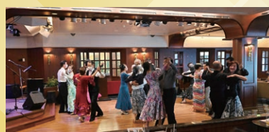
生演奏で優雅なダンスタイム