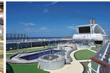
甲板は高級リゾートのよう