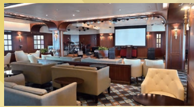
会場のホイルハウスバーは夜の営業中もダンスが踊れます

A・B両コースのお客様が揃った8月8日、クルーズネットワークのダンスプランに参加された方々を対象とした船内イベントが、今年創刊35周年を迎えたダンスビューの「読者の集い」として、船内のムーディなスペース「ホイルハウスバー」で開催されました。生バンドの演奏をバックに愛好家の皆さん同士やスタッフとの得難い交流の場となりました。