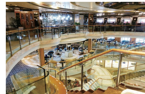
ゴージャスで開放感あふれる船内