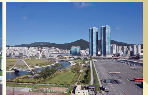
海外にも寄港。今回は韓国の釜山を訪れた