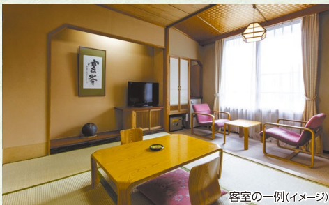
客室の一例(イメージ)