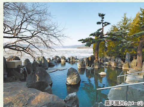
露天風呂(イメージ)