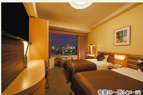
客室の一例(イメージ)